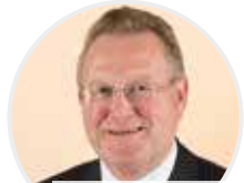
SANDER Vercamer Eerste gedeputeerde